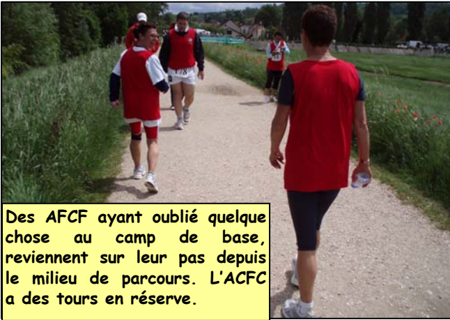
Des AFCF ayant oublié quelque chose au camp de base, reviennent sur leur pas depuis le milieu de parcours. L'ACFC a des tours en réserve.