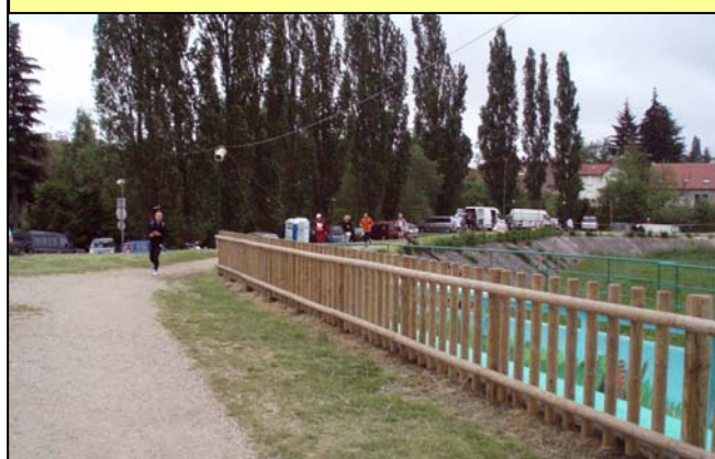
La super menthe