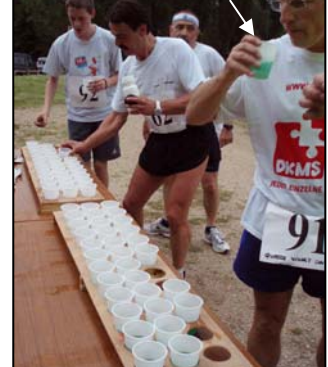
Petit déj. façon 12 h.