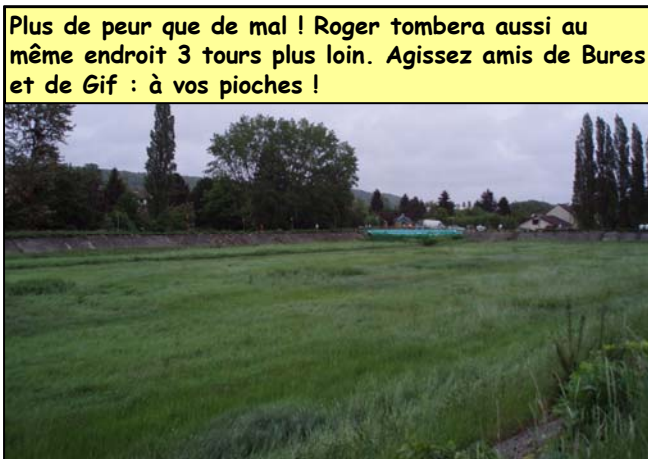
Plus de peur que de mal ! Roger tombera aussi au même endroit 3 tours plus loin. Agissez amis de Bures et de Gif : à vos pioches !