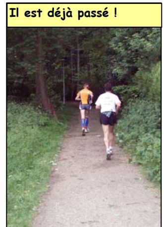
Il est déjà passé !

Attention, l'UFO orange est sur tes talons.