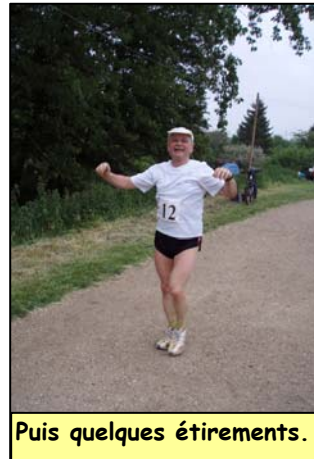
Puis quelques étirements.