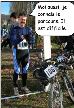
Moi aussi, je connais le parcours. Il est difficile.