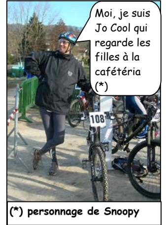
Moi, je suis Jo Cool qui regarde les filles à la cafétéria (*)