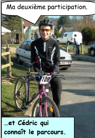
Ma deuxième participation.