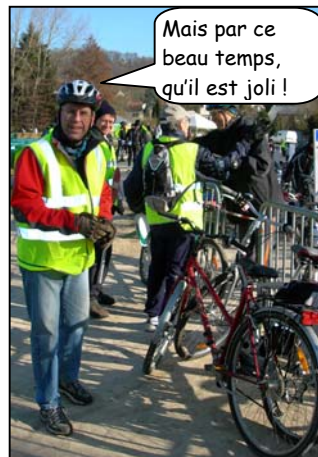
Mais par ce beau temps, qu'il est joli !