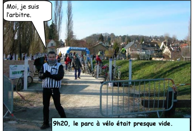
Moi, je suis l'arbitre.