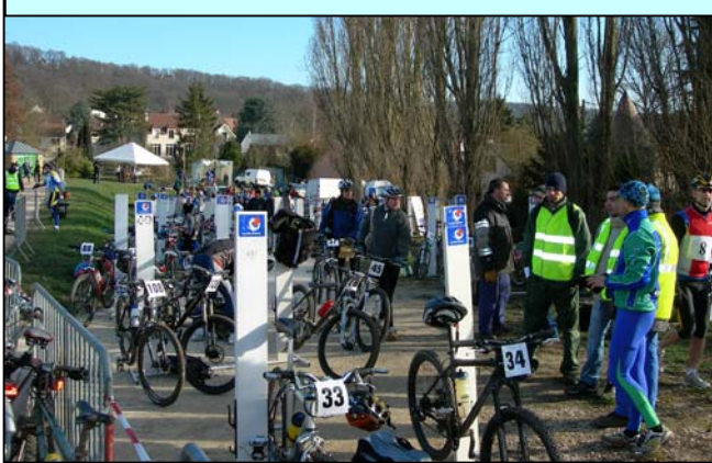
Mais à 9h30, beaucoup de monde était déjà arrivé, dont...