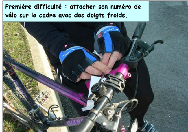
Première difficulté : attacher son numéro de vélo sur le cadre avec des doigts froids.