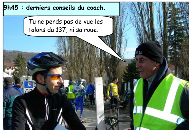
9h45 : derniers conseils du coach.