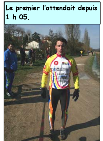
Le premier l'attendait depuis 1 h 05.