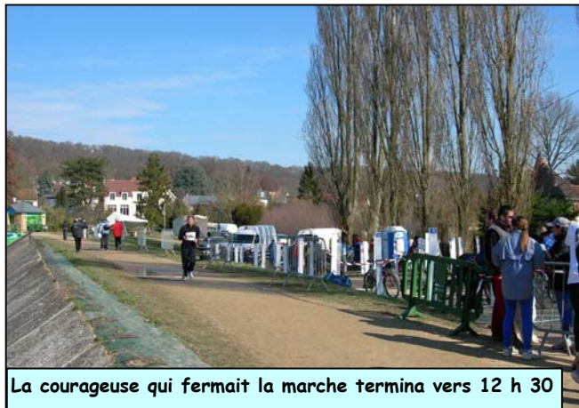
La courageuse qui fermait la marche termina vers 12 h 30