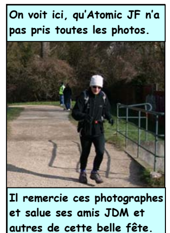
On voit ici, qu'Atomic JF n'a pas pris toutes les photos.