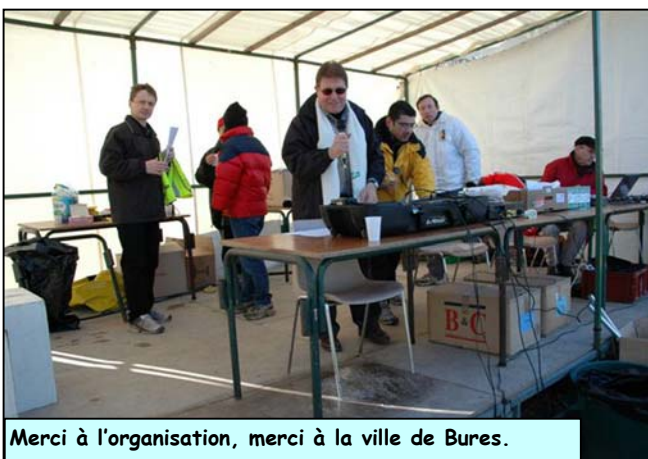
Merci à l'organisation, merci à la ville de Bures.