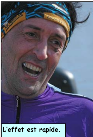
L'effet est rapide.