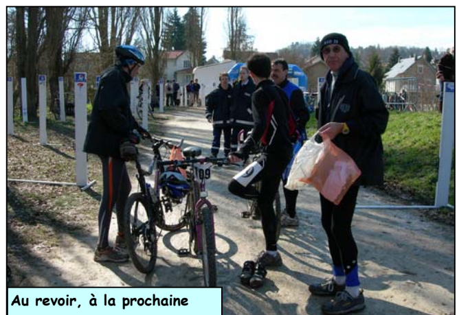
Au revoir, à la prochaine