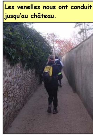
Les venelles nous ont conduit jusqu'au château.