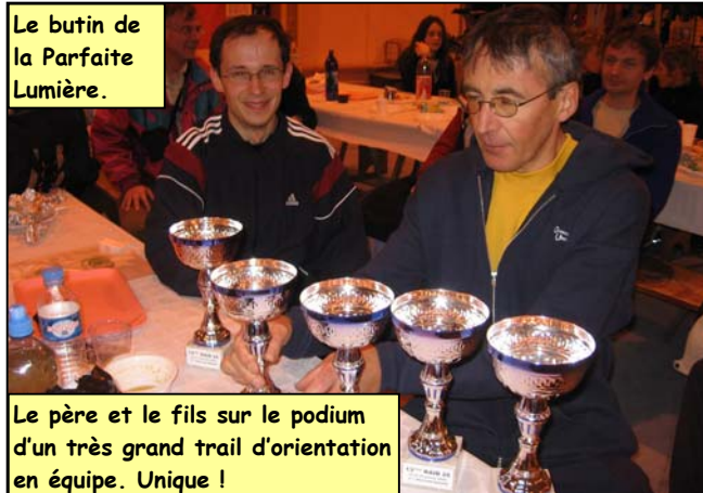
Le butin de la Parfaite Lumière.