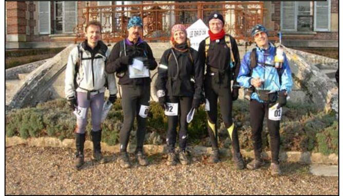
Ce qui fait que nous sommes arrivés ensemble au PP 106. Elles nous ont photographiés. Merci les filles !