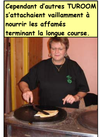
Cependant d'autres TUROOM s'attachaient vaillamment à nourrir les affamés terminant la longue course.