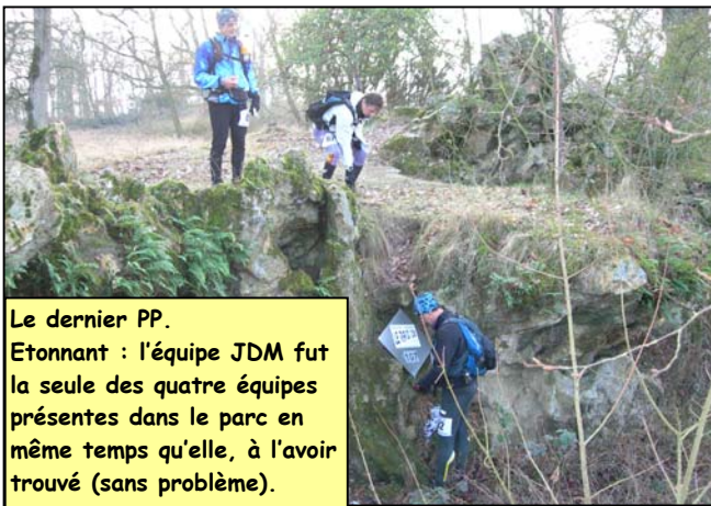
Le dernier PP. Etonnant : l'équipe JDM fut la seule des quatre équipes présentes dans le parc en même temps qu'elle, à l'avoir trouvé (sans problème).