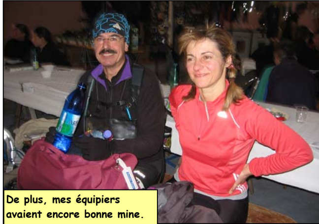
De plus, mes équipiers avaient encore bonne mine.