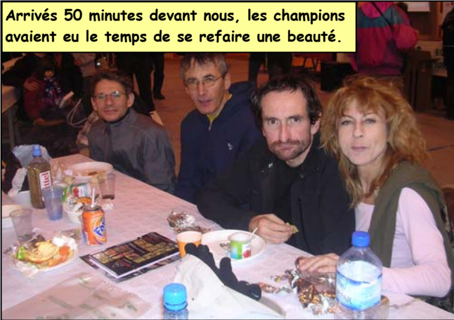
Arrivés 50 minutes devant nous, les champions avaient eu le temps de se refaire une beauté.