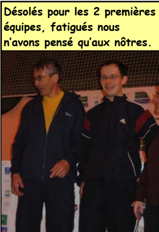
Désolés pour les 2 premières équipes, fatigués nous n'avons pensé qu'aux nôtres.