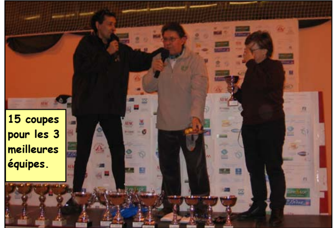
15 coupes pour les 3 meilleures équipes.