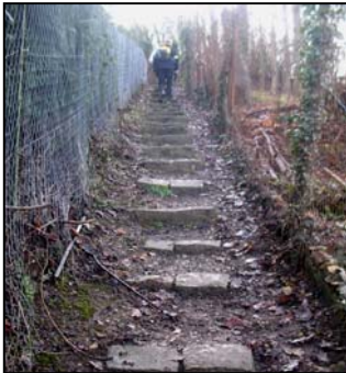
TUROOM a joué l'UTMB en plaçant, comme à Chamonix, une ultime et terrible montée conduisant au PP105.