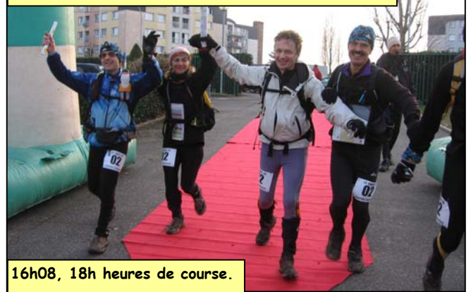
16h08, 18h heures de course.