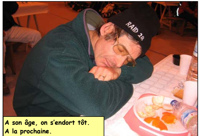
A son âge, on s'endort tôt. A la prochaine.