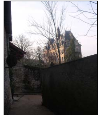
Ce fut une belle approche dans la lumière du soir.