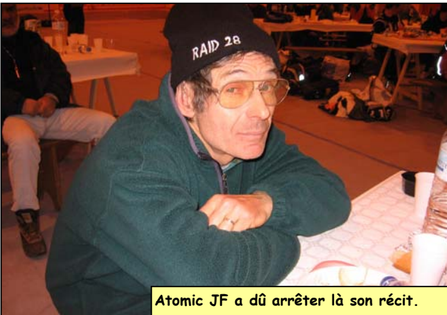
Atomic JF a dû arrêter là son récit.