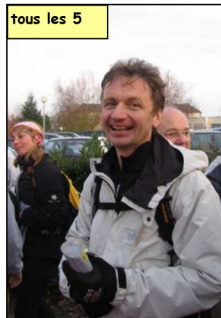
tous les 5