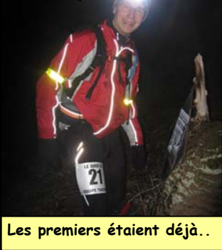
Les premiers étaient déjà..