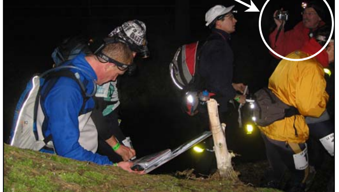
TUROOM les a vus et les a pénalisés de la valeur de la balise.