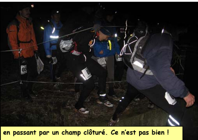
en passant par un champ clôturé. Ce n'est pas bien !