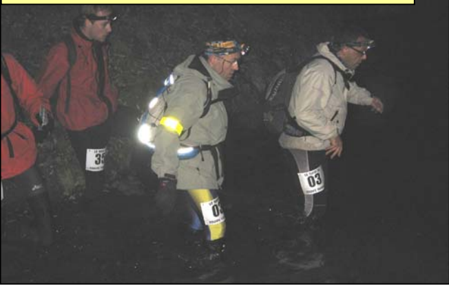
En revanche, un peu plus tôt, les zamis