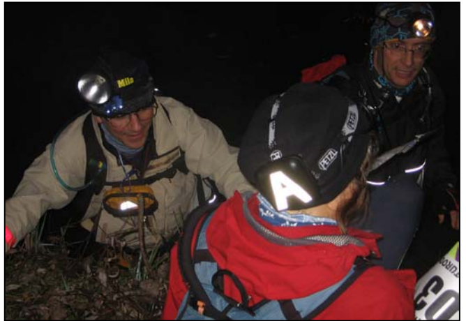
N'est-elle pas parfaite ma lumière ?