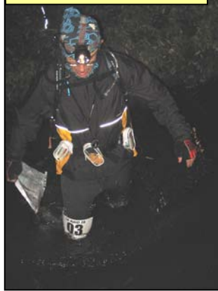
ont joué le jeu prévu...