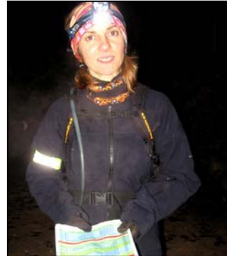
Pour nous, ce n'était qu'un petit bain, mais ce n'était pas interdit.