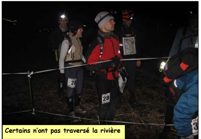
Certains n'ont pas traversé la rivière