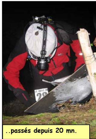
..passés depuis 20 mn.