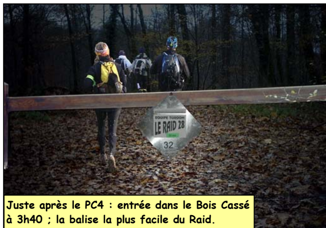
Juste après le PC4 : entrée dans le Bois Cassé à 3h40 ; la balise la plus facile du Raid.

JE ME SOUVIENS QU'IL Y A 40 ANS ALORS QUE LA SEULE FORME RECONNUE DE COURSE À PIED HORS DES STADES ÉTAIT LE CROSS (LE JOGGING A ÉTÉ INVENTÉ 10 ANS PLUS TARD), J'ALLAIS SEUL TROTTINER DANS CES FORÊTS PENDANT UNE HEURE (QUELLE FOLIE !) LE DIMANCHE MATIN. CE N'ÉTAIT DONC PAS ENCORE LE « JDM » MAIS LE « TDM. ».