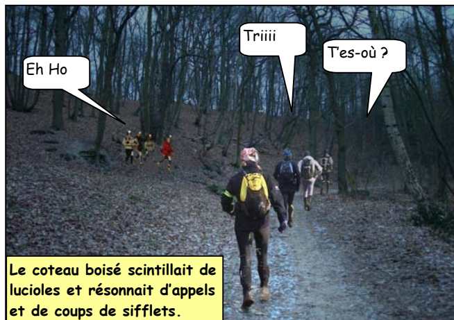
Le coteau boisé scintillait de lucioles et résonnait d'appels et de coups de sifflets.