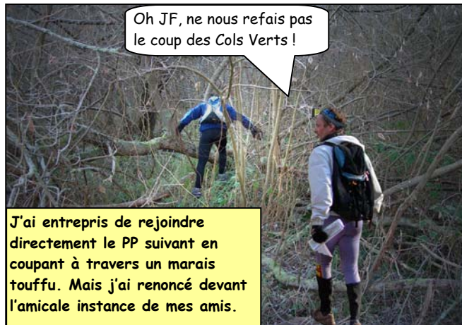
J'ai entrepris de rejoindre directement le PP suivant en coupant à travers un marais touffu. Mais j'ai renoncé devant l'amicale instance de mes amis.