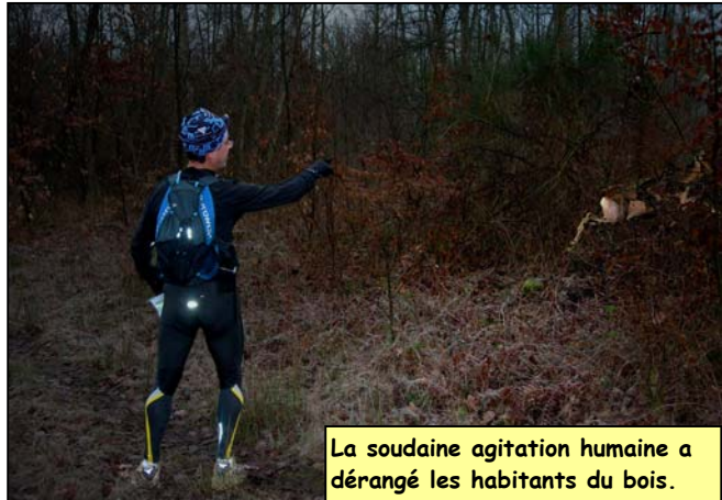
La soudaine agitation humaine a dérangé les habitants du bois.