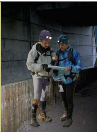
6h30, nous avons fait le point dans le passage sous la route, juste après le PC 6. Cela n'allait pas fort : au PC, notre équipe était la dernière des 34 équipes encore en course. Pour rester dans le Raid, il allait falloir sacrifier non seulement tous les PP bleus, mais aussi une partie des PP verts. Les 30 minutes perdues pour trouver 2 des 4 dernières balises se sont payées chères.