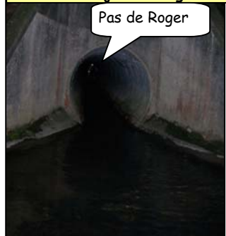
Pas de Roger