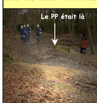
Le PP était là