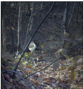
Le PP 48 dans sa dépression. Nous l'avons trouvé par le changement de numéro de parcelle.