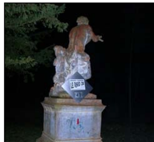
6h45, PP 49; parc du château de Plaisir ; statue de Pan. Mercure nous aurait certainement mieux inspiré : 15 mn pour faire 500 m.