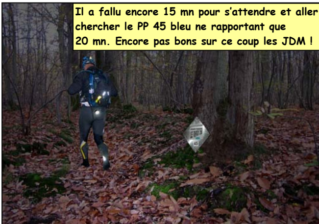
Il a fallu encore 15 mn pour s'attendre et aller chercher le PP 45 bleu ne rapportant que 20 mn. Encore pas bons sur ce coup les JDM !