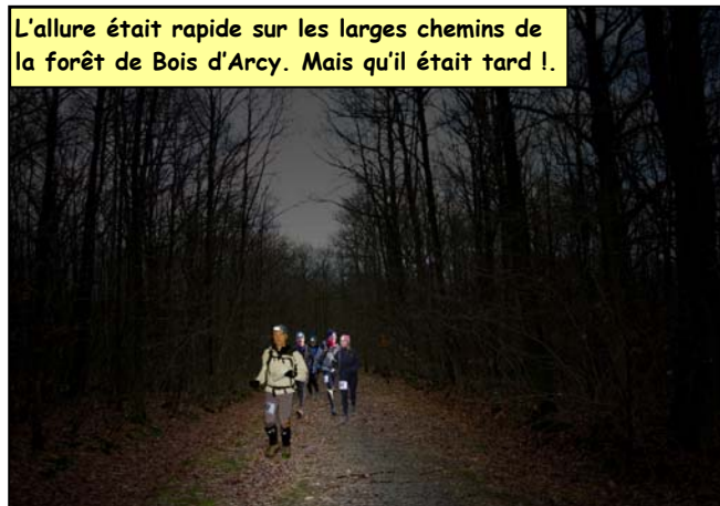
L'allure était rapide sur les larges chemins de la forêt de Bois d'Arcy. Mais qu'il était tard !