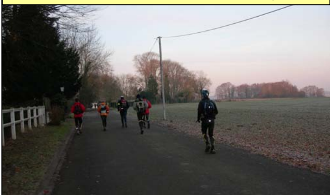
Vallon du Guyon, l'Aunay Rogin, 9h17. La Parfaite Lumière et les gens du PP 69 (Tigrou des Bois) nous ont rejoint.