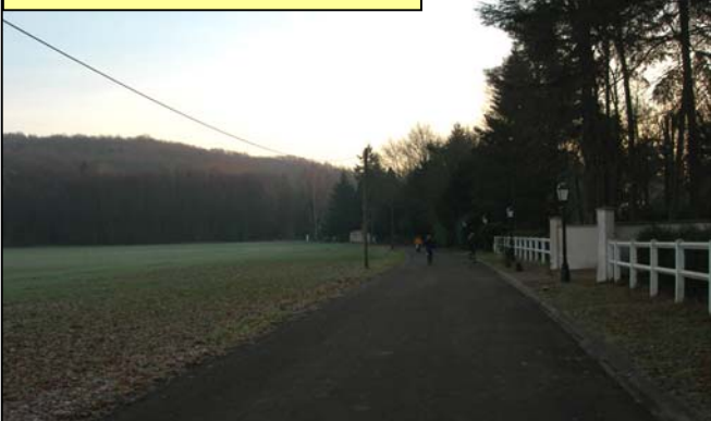
Derrière nous, le bois de la Côte et le chemin d'Epône. Il gelait.