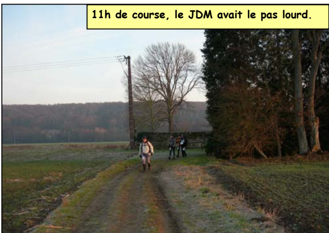
11h de course, le JDM avait le pas lourd.