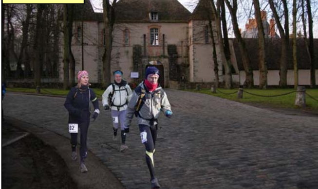
Son château, ses pavés.