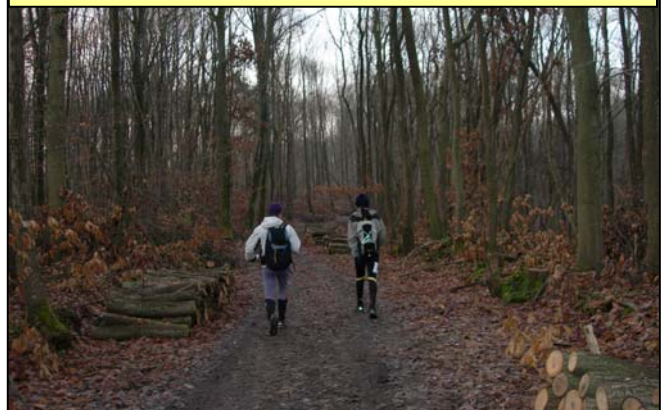
Mais oui ! le fameux Trail Bures-Epône passe par là !