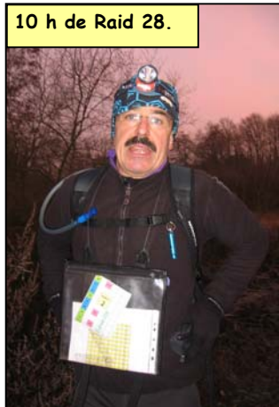
10 h de Raid 28.