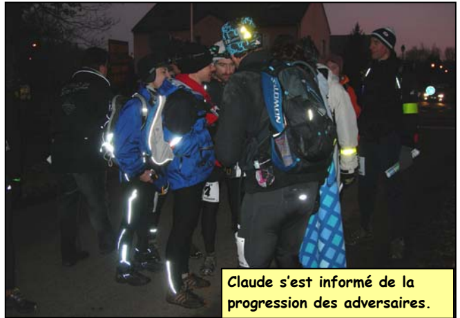
Claude s'est informé de la progression des adversaires.