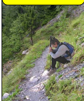
NOMBREUX ARRÊTS DE RÉCUPÉRATION POUR ARRIVER EN HAUT