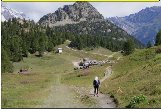
REFUGE DU COL CHÉCROUI : 67 KM, 10 H 13.