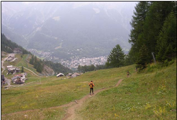
LA DIFFICILE DESCENTE JUSQU'A COURMAYEUR.