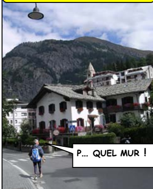
P... QUEL MUR !