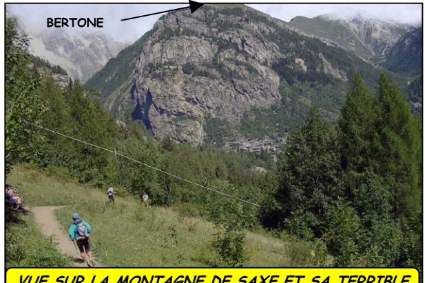
VUE SUR LA MONTAGNE DE SAXE ET SA TERRIBLE MONTÉE DE COURMAYEUR AU REFUGE BERTONE.