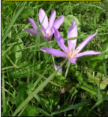
COLCHIQUES DANS LES PRÉS